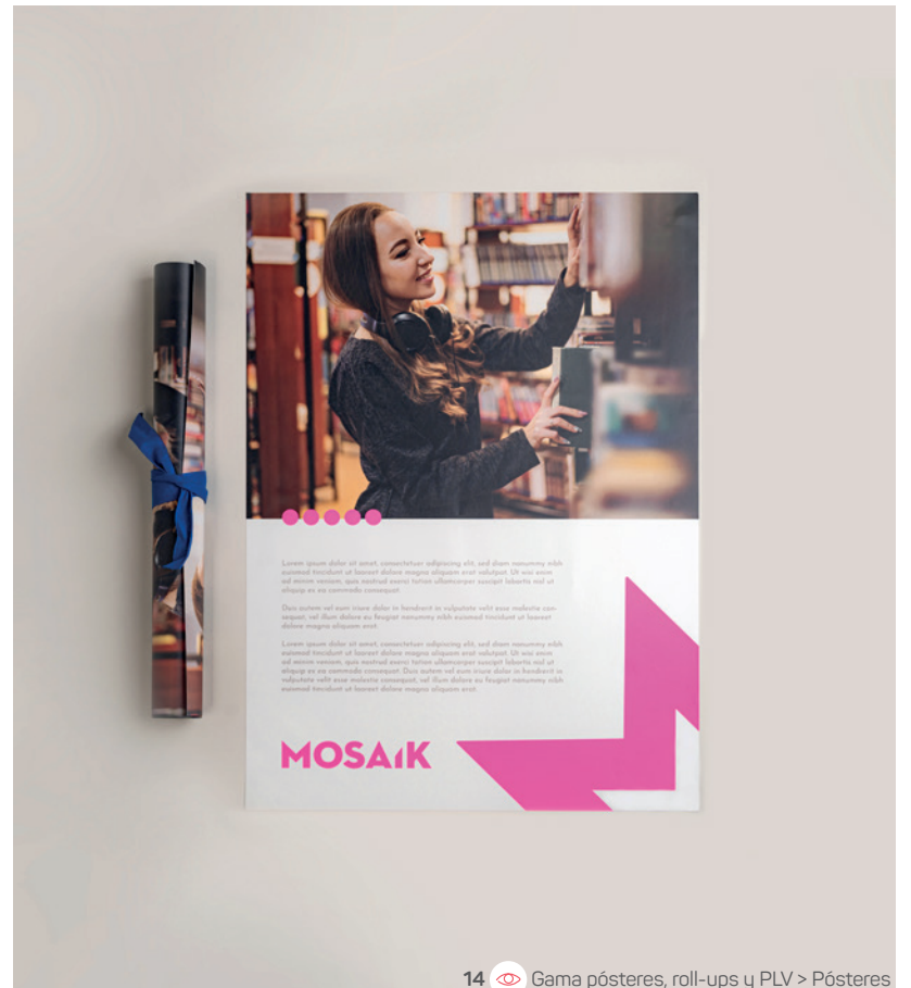
14 Gama pósteres, roll-ups y PLV &gt; Pósteres