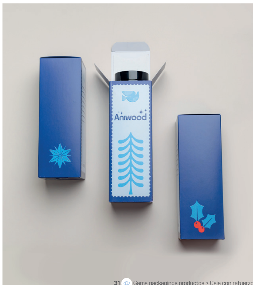
31 Gama packagings productos &gt; Caja con refuerzo