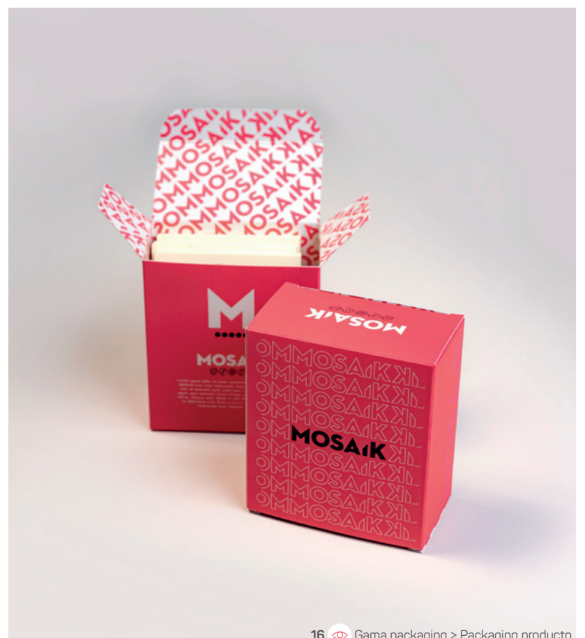
16 Gama packaging &gt; Packaging producto