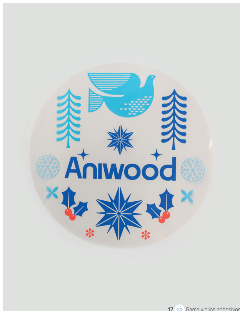
17 Gama vinilos adhesivos