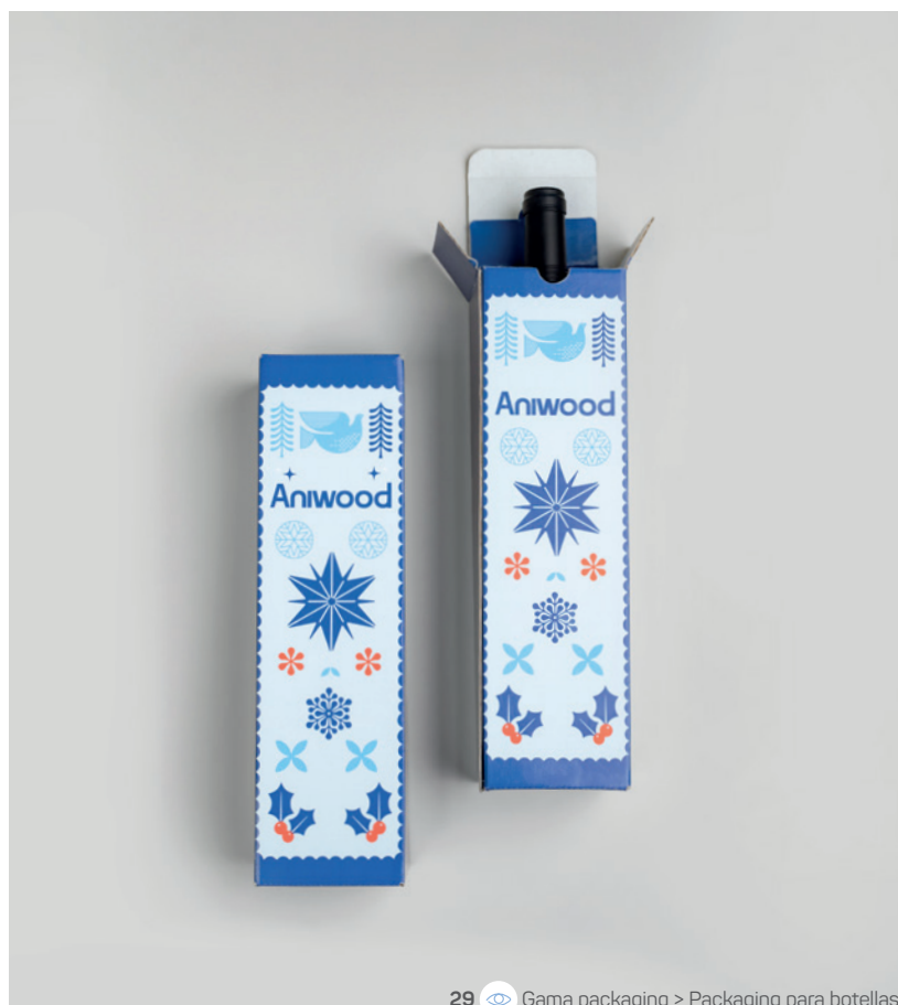
29 Gama packaging &gt; Packaging para botellas