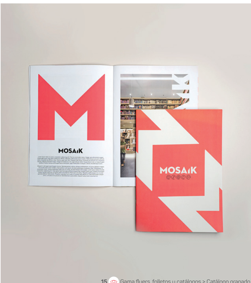
15 Gama flyers, folletos y catálogos &gt; Catálogo grapado

9 x 5 x 10 cm 400g cartón blanco semimate Plastificado mate Soft Touch 1 cara Cuatri 2 caras