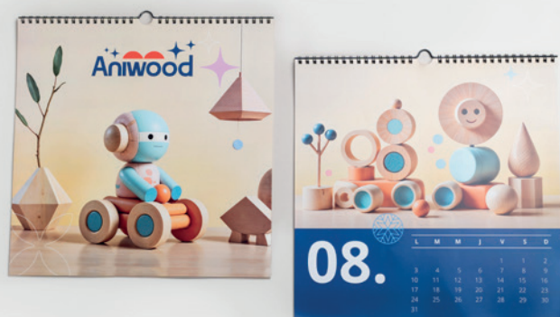
22 Gama oficina > Calendarios