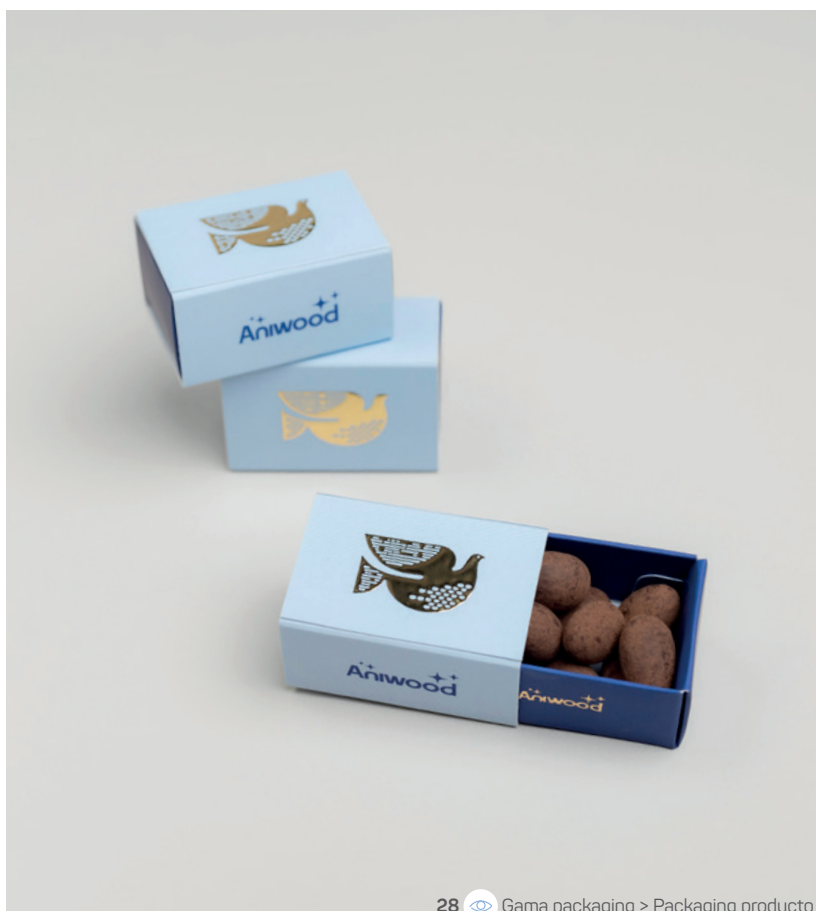
28 Gama packaging &gt; Packaging producto