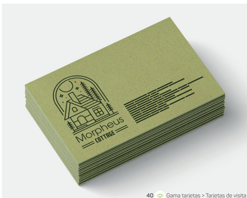
40 Gama tarjetas > Tarjetas de visita