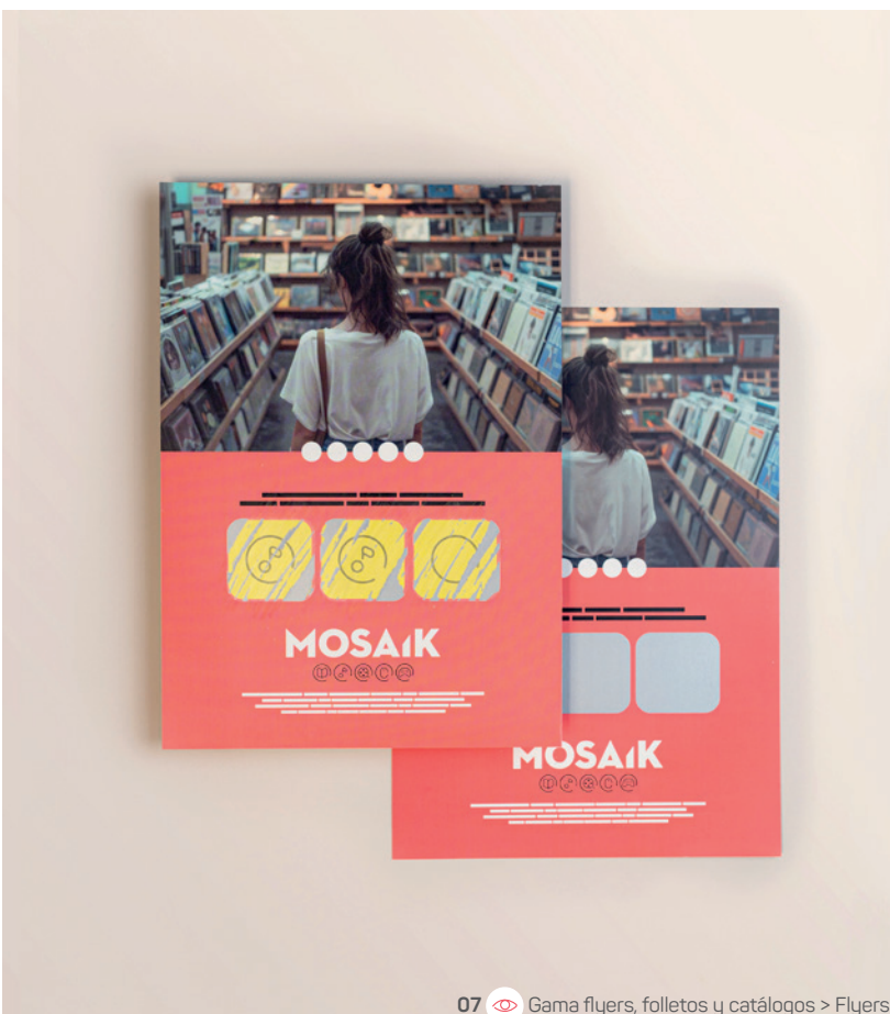
07 Gama flyers, folletos y catálogos > Flyers