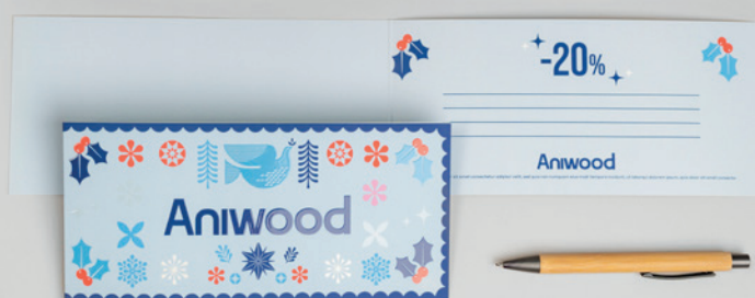
23 Gama tarjetas > Tarjetas de invitación