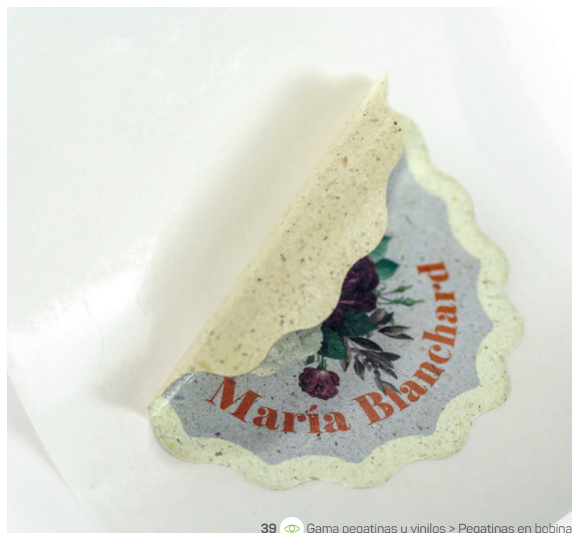
39 Gama pegatinas y vinilos > Pegatinas en bobina

Sostenibilidad rima con creatividad. Estos soportes son ecológicos: papel de fibras vegetales, vinilo sin PVC, tarjetas en papeles reciclables o lonas diseñadas ecológicamente. La identidad visual también pasa por la elección de los materiales. Estos productos reciclados realzan tu identidad y tus valores.