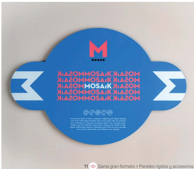
11 Gama gran formato > Paneles rígidos y accesorios