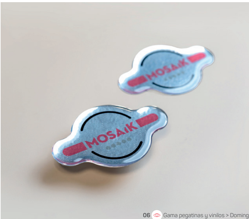
06 Gama pegatinas y vinilos > Doming